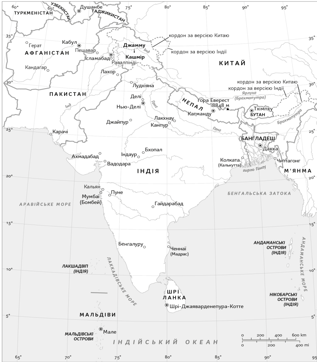
На основі мапи ООН